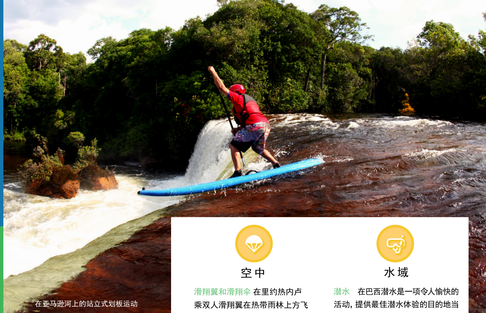
在亚马逊河上的站立式划板运动